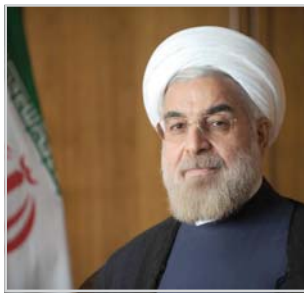
سینا رحیم پور گروه سیاسی

رئیس جمهور، «رفع تحریم‌های ظالمانه» را موجب سرمایه‌گذاری در تمامی زمینه‌ها از جمله محیط زیست عنوان کرد و گفت: حل مشکلات زیست محیطی و حفظ منابع طبیعی، مستلزم استفاده متعال از طبیعت، ارتقای فرهنگ و سرمایه‌گذاری و استفاده از فناوری است. به گزارش ایرنا، حسن روحانی در بخش دیگری از سخنان خود گفت: هنگامی که می‌گوییم تحریم‌های ظالمانه باید از بین برود، برخی با شنیدن این حرف چشم‌هایشان زیاد تیر خد.